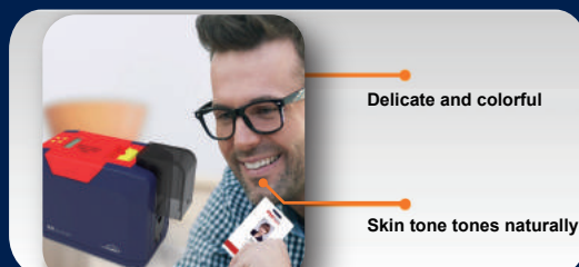
High quality photo processing by Dye sublimation technology